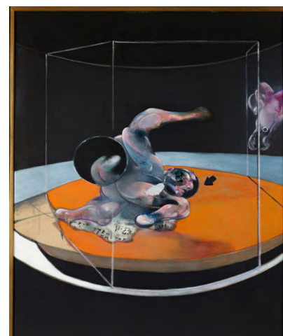
Francis Bacon (1909-1992), Figure in Movement , 1976. Oil and dye transfer lettering on canvas. 78¼ x 58 in (198.9 x 147.3 cm)